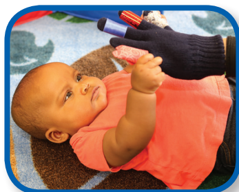
Finger Squeeze 0-3 months