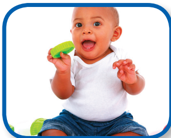
¡Estírate y agárralo! De 3 a 9 meses