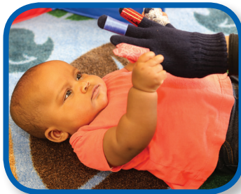
Apretar con los dedos De 0 a 3 meses