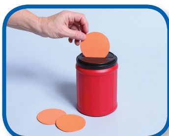
Ponlo en la ranura De 6 a 12 meses