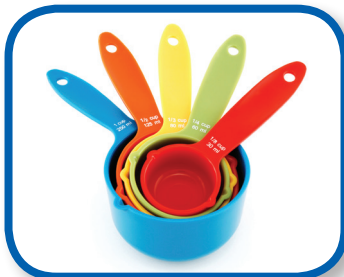
Juguetes en la cocina De 3 a 12 meses